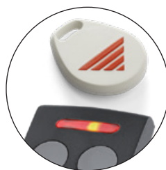
S500 ADÓK ÉS PROXIMITZK LEOLVASÁSA RFID TECHNOLÓGIÁVAL