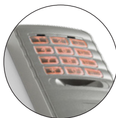
ÜTÉSÁLLÓ TARTÓ POLIKARBONÁT BŐL HÁTTÉRVILÁGÍTÁSSAL DKSDUAL