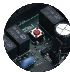
1000 KÓD MEMORIZÁLÁSA